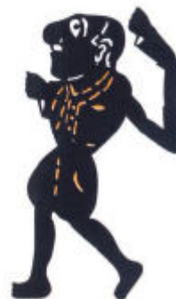
Σκίτσος: Ε. Σπαθάρης από το βιβλίο του Ο γάμος του Καραγκιόζη, εκδ. Ακρίτας

ΚΑΡΑΓΚΙΟΖΗΣ: Μωρέ, όλα τα ψητά θα τα φάω όκι τα δύο. Άλλος στον καλό τον φούρναρη εδώ! Όποιος ψήσει σήμερα δε θα ξεψήσει.